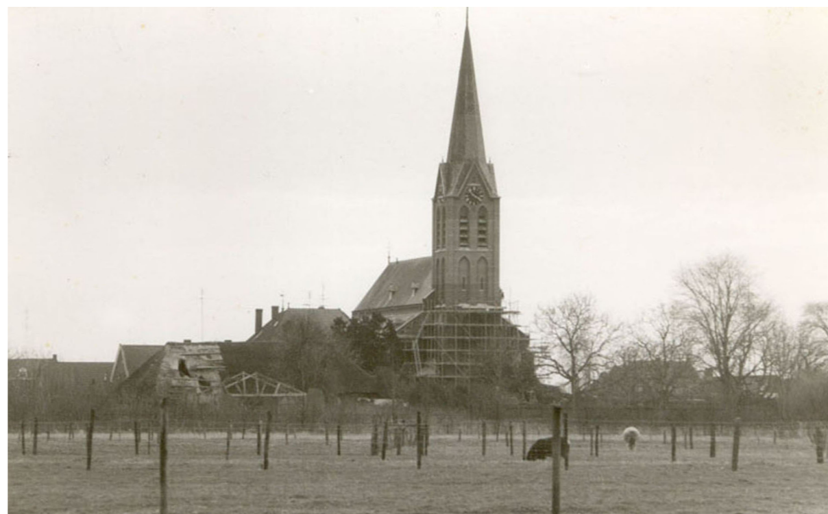
Remigiuserk in de stijgers rond 1980.