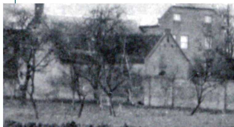
Herberg 'Het Trapke'

Voor de bouw van een nieuwe kerk moest grond verworven worden. Het huis, de stal en het erf van buurman B.A. Romeijn werd daarom aangekocht. Dit huis, herberg 'Het Trapke', was gelegen ten oosten van de pastorie. Het schuurtje achter de boerderij werd voor afbraak verkocht. Waarschijnlijk mocht Romeijn er nog een tijdje blijven wonen, maar op 12 december 1893 werd hem per deurwaarder de huur opgezegd. Het land werd opnieuw afgepaald; er werden sloten gedempt en een heg geplant. De vroegere boomgaard van Romeijn veranderde in een zwarte bessentuin en uiteindelijk werd ook zijn vroegere huis gesloopt en de materialen hiervan verkocht. Ook had de kerk in 1893 van B.A. Romeijn aangekocht het recht van beplanting op de gemeentepas vóór zijn huis met alle daarop staande bomen en knotten groot 9 are en 90 ca. De afbraak van de -oude kerk werd onderhands